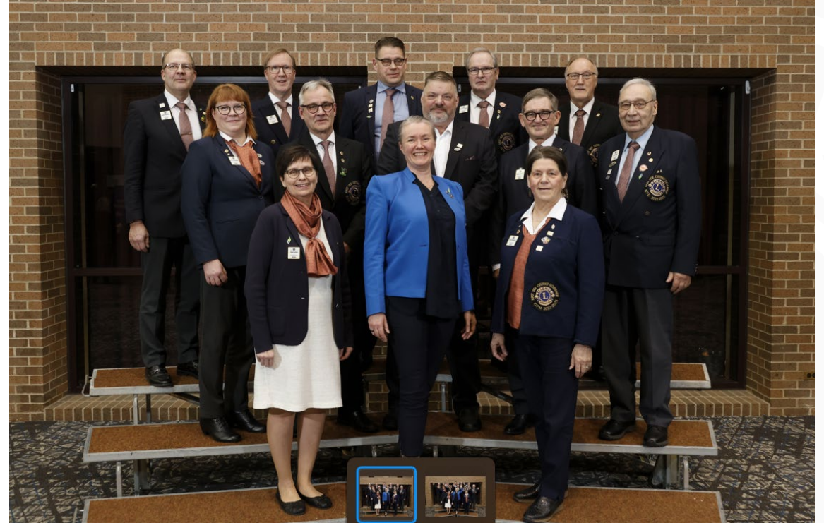
1VDG kv-koulutuksessa keväällä 2023