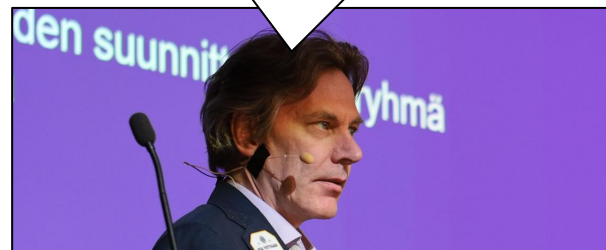
PUHEENJOHTAJAN 2023 - 2024

“Yhdessä pystymme hyvän ihmeisiin” “Tillsammans är vi kapable goda mirakel”