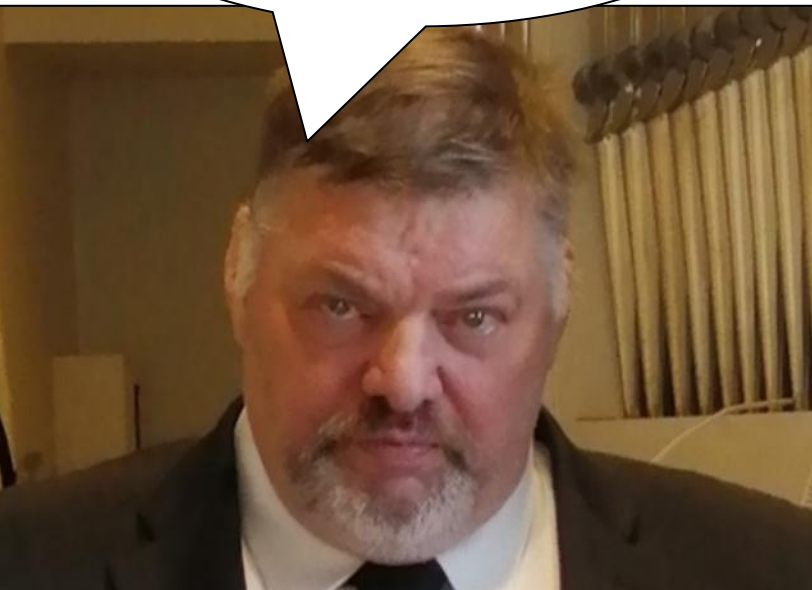
B-PIIRIN TEEMA 2023 - 2024

“Ei kaikille kaikkea vaan jokaiselle jotain” “Inte allt, utan något för alla”